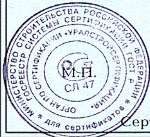
Схема сертификации 3.